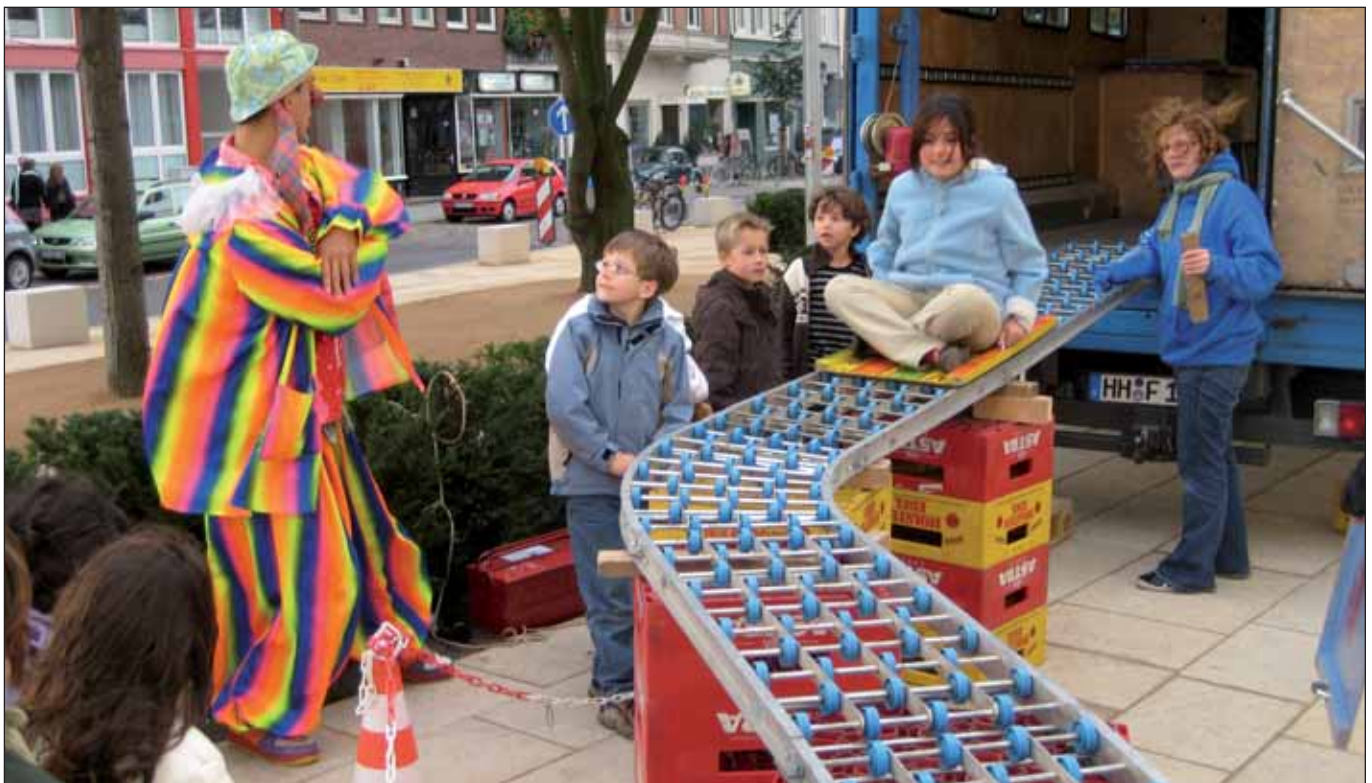
Bewegung tut gut! - das gilt leider kaum für die Hamburger Politik

Okay, es ist vielleicht immer ein wenig schräg, die eine öffentliche Investition gegen die andere auszuspielen, aber ich finde schon, dass der Hamburger Senat oft die falschen ausgabenpolitischen Akzente setzt. Nehmen wir nur den teilweise desolaten Zustand vieler (Schul-)Turnhallen oder den Umstand, dass z.B. im Bezirk Mitte fast überall Hallen(kapazitäten) mangels Neubau in den vergangenen Jahren fehlen. Hier wären schon seit langem einige Millionen Euro locker zu machen gewesen, um die Situation des Schul- und Vereinssports und damit die von Zehntausenden jüngeren und älteren Menschen nachhaltig zu verbessern.