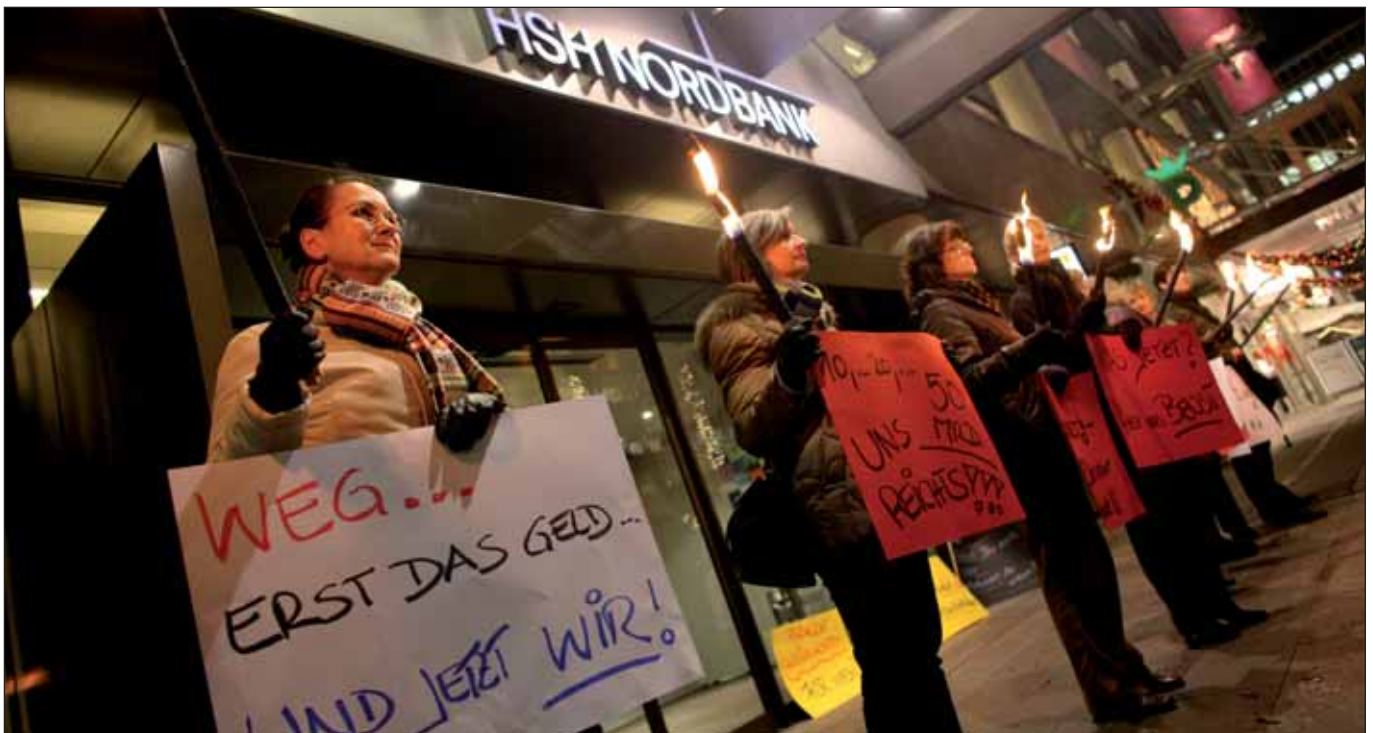
HSH-Beschäftigte protestieren gegen geplanten Stellenabbau

Die HSH Nordbank, die Elbphilharmonie und die öffentlichen Finanzen haben sich in den zurückliegenden Monaten zu einem Albtraum für die Hamburger Politik entwickelt. Ein kurzer persönlicher Rückblick.