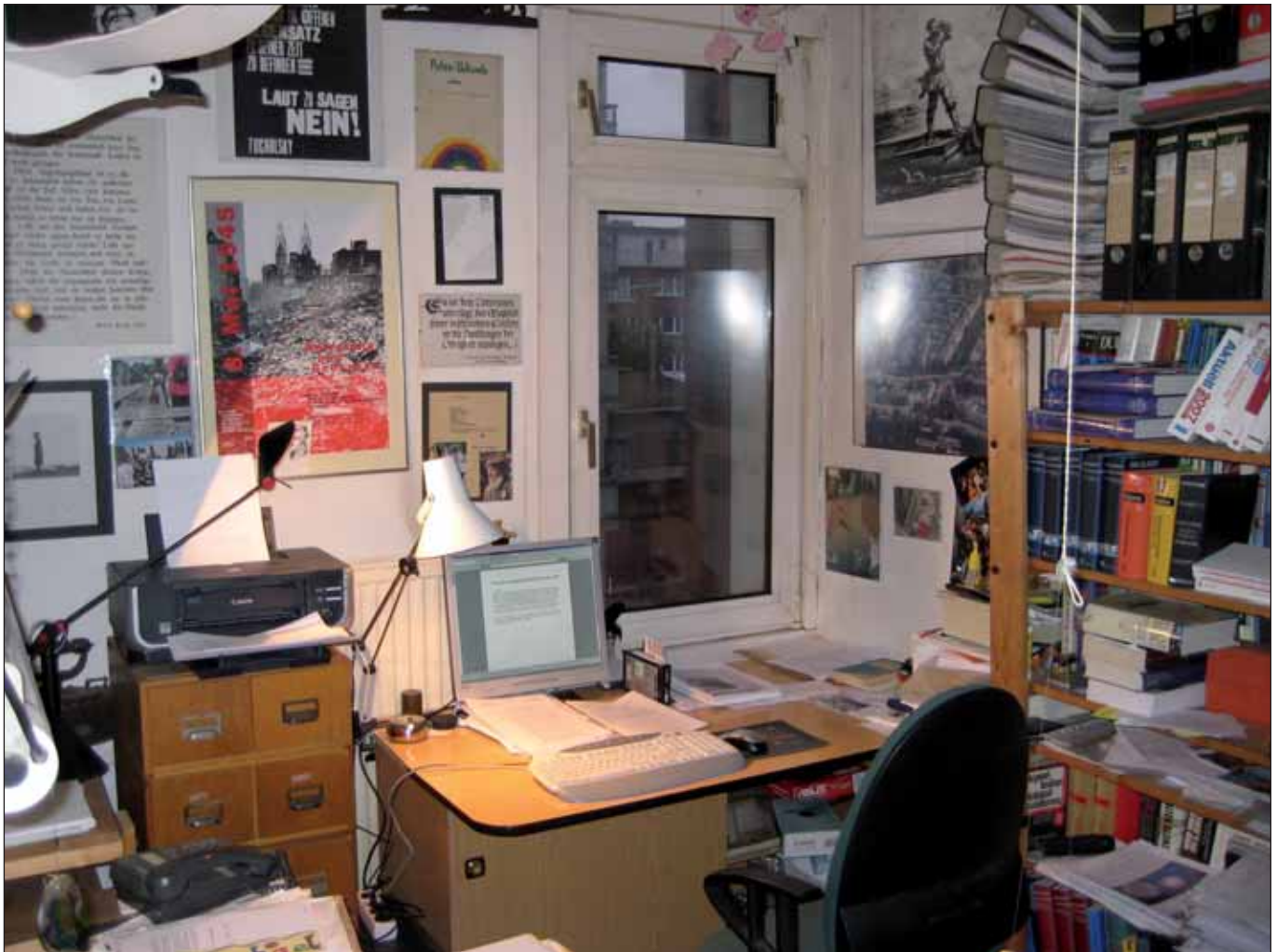
Blick vom Schreibtisch auf den Innenhof

Studiert habe ich von 1978 bis 1984 an der Universität Hamburg, in einer Zeit, in der in der hochschulpolitischen Linken heftige Debatten tobten um das aus der Frauenbewegung übernommene Motto »Das Persönliche ist politisch«. Diese für mich seitdem weitgehend gültige Erkenntnis will ich an den Anfang der nachfolgenden persönlichen Betrachtungen setzen, die meiner Wohnsituation gezollt sind.