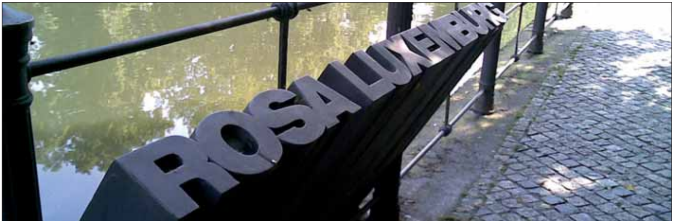
Gedenktafel am Berliner Landwehrkanal