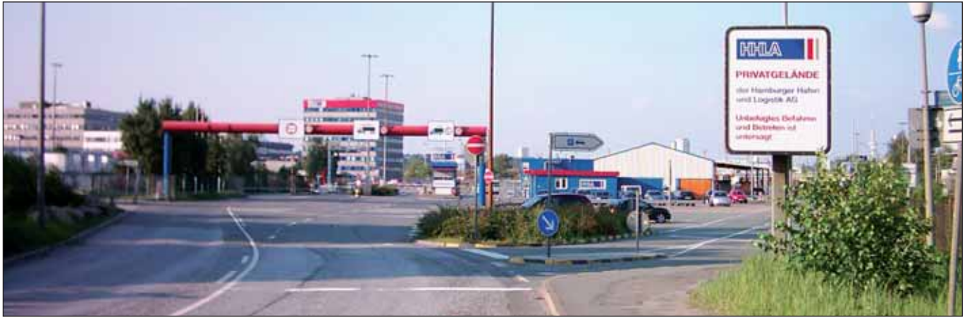
HHLA: Fast alles leer?

an der Spitze (Bund: bei 8,6% stagnierend; Hamburg: Anstieg von 8,8 auf 9,0%). Das ist auch nicht weiter überraschend, weil diese vermeintlich gut aufgestellten Bundesländer mit ihrer hohen Exportorientierung (40% des Hamburger BIP sind exportabhängig) von der Weltwirtschaftskrise besonders hart betroffen sind.