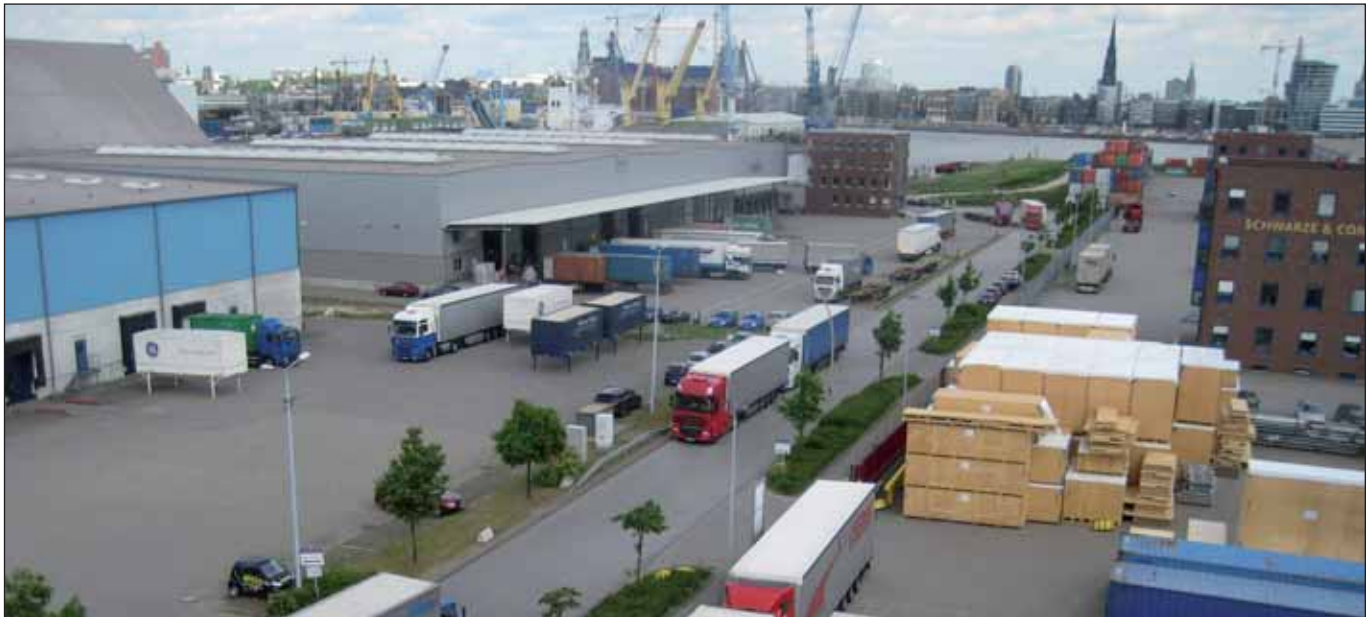
Ansicht der Afrikastraße, eines kleinen Teils des Freihafens

Der Senat macht zur Zeit in wirtschafts- und finanzpolitischer Hinsicht wirklich kein gute Figur! Allein die Desaster mit der HSH Nordbank, der Elbphilharmonie und Hapag Lloyd werden die SteuerzahlerInnen schwer belasten. Selbst ein Projekt, das glücklicherweise bisher noch ohne größere Kosten betrieben wurde, hat er in diesen Tagen ebenfalls gegen den Baum gesetzt: Der von Senator Axel Gedaschko (CDU) seit November 2008 betriebene Plan, den traditionsreichen Hamburger Freihafen von ca. 1.636 auf 60 Hektar drastisch zu reduzieren, muss zurückgestellt werden: Bundesfinanzminister Peer Steinbrück (SPD) hat die genehmigungspflichtige Verkleinerung vorerst abgelehnt – eine Entscheidung, die offenbar bereits vor einigen Wochen gefallen ist und bislang zurückgehalten wurde.