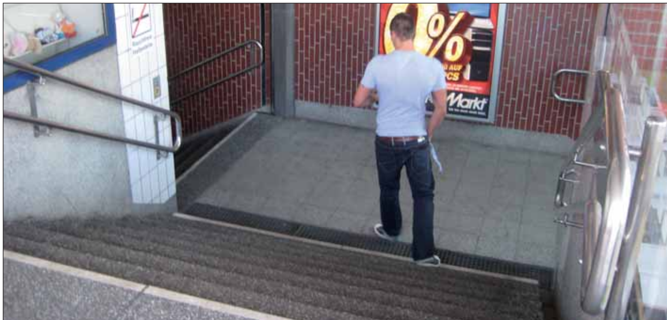
Barriere für Rollstühle & Kinderwagen: Treppe zur U-Bahn Ochsenzoll

Mittlerweile ist in die Forderung nach einem barrierefreien Hamburg Bewegung gekommen. Über viele Jahre haben immer wieder Behindertenverbände, aber auch SeniorInnen, Eltern und andere auf die Schwierigkeiten hingewiesen, mit dem Rollstuhl oder auch dem Kinderwagen in der Stadt unterwegs zu sein. Meist vergeblich. Doch in jüngerer Zeit überschlagen sich die Parteien förmlich, um den berechtigten Forderungen nach Barrierefreiheit im öffentlichen Raum nachzukommen, einem Ziel übrigens, das spätestens seit der Unterzeichnung der UN-Konvention über die Rechte von Menschen mit Behinderungen Ende März 2009 auf der Tagesordnung steht.