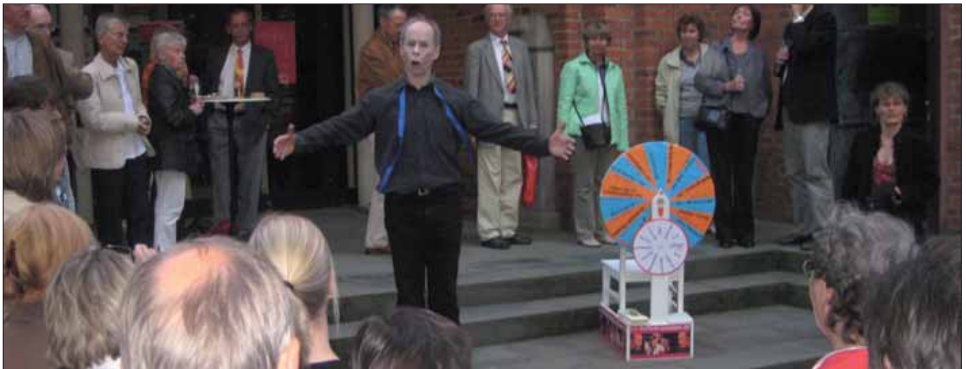
Auf dem Stadtteilfest in St. Georg 2008

Die Monate Mai und Juni werden von vielen Initiativen und Vereinen genutzt, Nachbarschafts-, Quartiers- und Stadtteilfeste zu organisieren. Hier finden sich Jung und Alt zusammen, hier wird gefeiert, geratscht und gestritten, hier wird so etwas wie Zusammenhalt und quartiersbezogene Identität entwickelt. Alles gute Gründe, um diese Projekte zu unterstützen und mit Zuschüssen aus bezirklichen Mitteln, Verfügungsfonds oder sonstigen öffentlichen Kassen zu fördern!