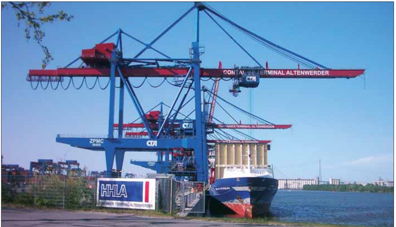
HHLA: Rückgang der Umschlags- und Transportmengen

... schwächt sich ab«, behauptet Wirtschaftssenator Gedaschko. Im Verbund mit Finanzsenator Michael Freytag hofft Hamburgs Wirtschaftsbehörde auf ein baldiges Ende der Rezession. Schönrederei und politisch verbrämte Untätigkeit bleiben die charakteristischen Merkmale der CDU-Politik.