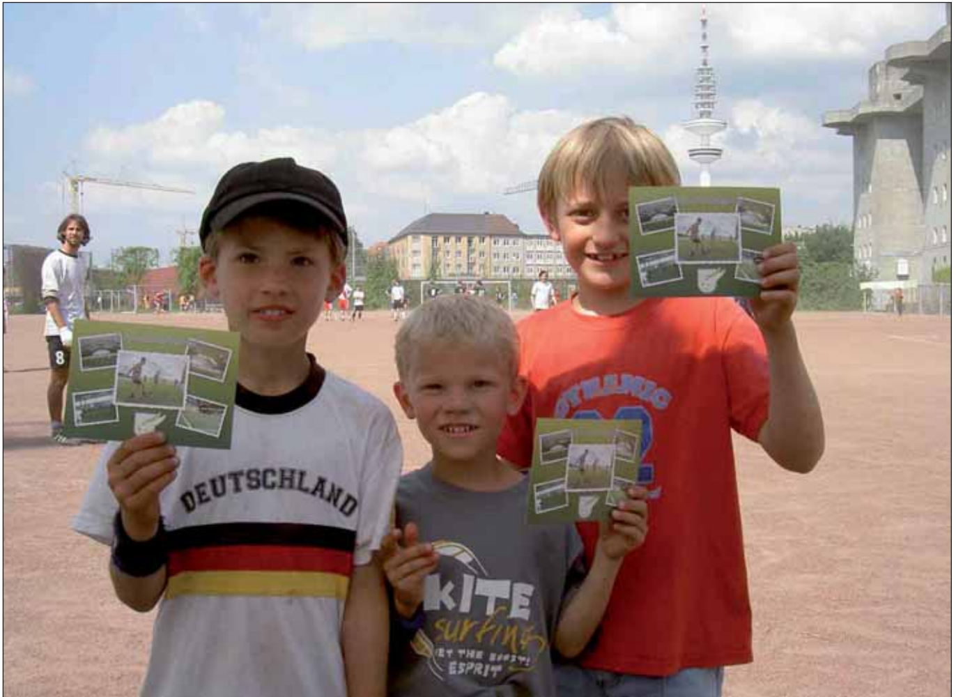
Kids bolzen und posieren auf dem Heiligengeistfeld

Auf der Bürgerschaftssitzung am 13. Mai 2009 stand ein SPD-Antrag zur Abstimmung, in dem es um die Unterstützung der Sportinitiative »Kids in die Clubs« ging. Die SPD hatte beantragt: »Die Bürgerschaft möge beschließen: Der Senat wird ersucht: 1. in Zusammenarbeit mit der Hamburger Sportjugend geeignete Maßnahmen aufzuzeigen, wie das Projekt »Kids in die Clubs« langfristig finanziell gesichert werden kann; 2. geeignete Möglichkeiten aufzuzeigen, wie das Projekt verlässlich im Haushalt der Freien und Hansestadt Hamburg gesichert werden kann und alle Sportarten berücksichtigt werden können; 3. der Bürgerschaft bis zum 31.10.2009 über die Umsetzung zu berichten.« Statt eine feste Summe zu fordern und damit die Jugendarbeit in den Sportvereinen auf sicherere Beine zu stellen, blieb der Antrag in seinem Petikum zwar reichlich unscharf, er wurde dennoch von der amtierenden CDU-GAL-Mehrheit abgelehnt.