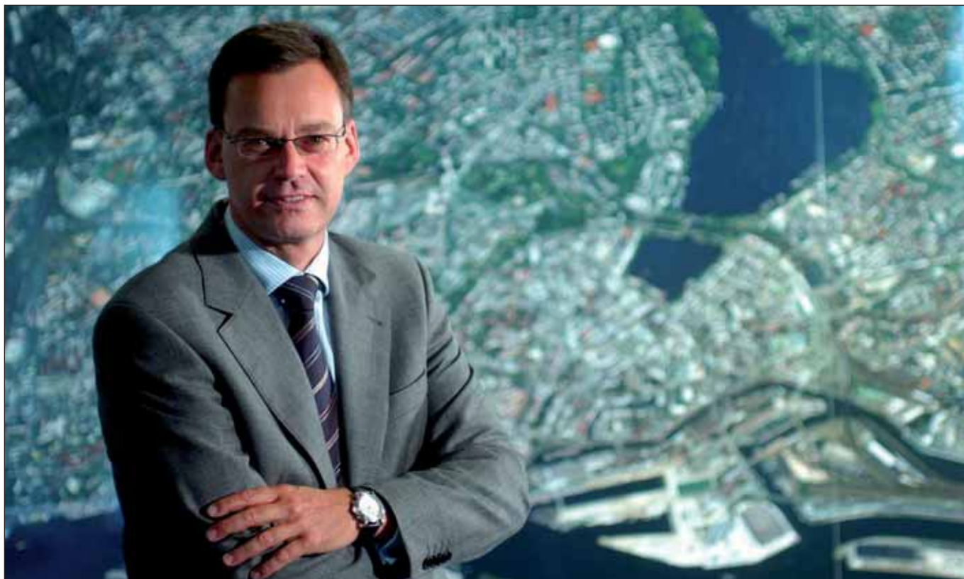
Lautes Pfeifen im Wald: Der Wirtschaftssenator »macht Mut für das nächste Jahr«

Es gibt sie noch – die Schönwetterpropheten. Beispielsweise den Hamburger Wirtschaftssenator Axel Gedaschko: Durch die kluge Haushalts- und Finanzpolitik des schwarz-grünen Senats werde »passgenau die sich langsam abzeichnende konjunkturelle Erholung gestützt«. Der Hamburger Senat werde trotz aller Sparvorgaben nicht bei den geplanten Investitionen kürzen oder streichen. Positiv sei zudem zu vermelden, dass der Einzelhandel in Hamburg aktuell überdurchschnittlich gut dastehe und auch die Situation auf dem Arbeitsmarkt besser sei als im Bund.