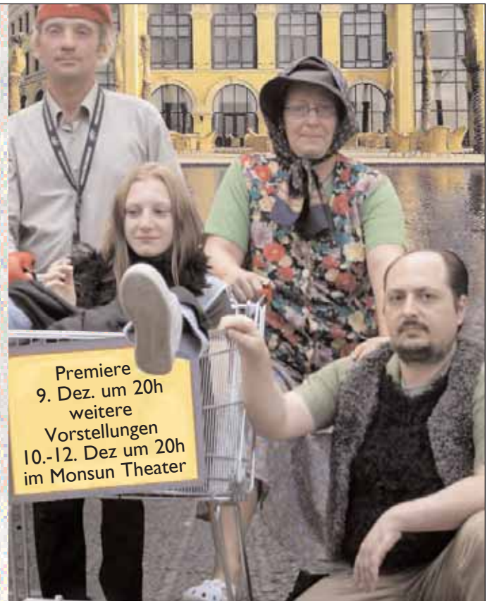
Aus der Programmankündigung des Monsun-Theaters

Der Dezember ist traditionell der Monat der Weihnachtsmärchen für Kinder, und so hat sich auch das Monsun-Theater in der Friedensallee 20 ein Grimmsches Werk vorgenommen, geeignet allerdings mehr für Erwachsene. Das Stück frei nach einer Idee von Iring Fetscher trägt den schönen Titel »Die Bremer Stadtmusikanten oder: Die erste alternative Hausbesetzung«. Das altbekannte Märchen wird auf die Jetztzeit übertragen, und die vier Stadtmusikanten werden von DarstellerInnen gegeben, die ohne Arbeit, ohne Wohnung und ohne Zukunft zu sein scheinen. So machen sich die vier auf den Weg, irgendwo unterzukommen, und finden schließlich ein Obdach in einer »Villa reicher Unternehmer, die an dem Elend anderer ihr Geld verdienen«. In einer gemeinsamen Aktion jagen sie den eine neue Gaunerei ausheckenden Unternehmern Angst ein und veranlassen sie zur Flucht – und zur Erfahrung, was Obdachlosigkeit bedeutet. Premiere ist am 9. Dezember , weitere Aufführungen sind für den 10., 11., und 12. Dezember jeweils um 20 Uhr angesetzt. Der Eintritt beträgt 15/12 Euro.