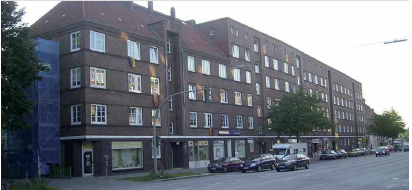
Auch immer teurer: Mietwohnungen in Hamburg-Horn

eigenen Problemlage und Ausgrenzung ist, wie all die Bürgerinitiativen beweisen, schon lange am schwinden.