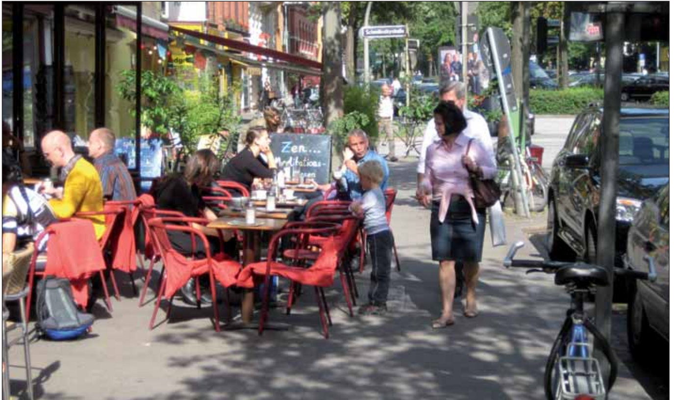
Lange Reihe shared spaced?

Im Koalitionsvertrag von CDU und GAL ist vor zwei Jahren fixiert worden, dass in jedem Bezirk eine Straße als Shared-Space-Zone ausgewiesen wird. Nach mehr oder weniger ergebnislos gebliebenen Schriftlichen Kleinen Anfragen hat sich jetzt der Senat erstmals zu den vorgeschlagenen bzw. geprüften Straßen(abschnitten) geäußert. Unterlagen sind für folgende (z.T. bisher überhaupt noch nicht öffentlich erörterte) Straßenräume zur weiteren Prüfung bei der Behörde für Stadtentwicklung und Umwelt (BSU) eingereicht worden: