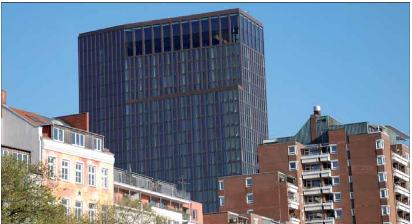
Blick hinauf: Empire-Riverside-Hotel in St. Pauli

Nur 1.185,- (eintausendeinhundertfünfundachtzig!) Euro kostete der Eintritt zum »Immobilien-Symposium Hamburg 2010«, das das Hamburger Abendblatt am 9./10. Februar im feinen Empire-Riverside-Hotel in St. Pauli durchführte. Der Ort war nicht schlecht gewählt, hätten Menschen aus Sozialwohnungen, benachteiligten Vierteln des Hamburger Ostens,