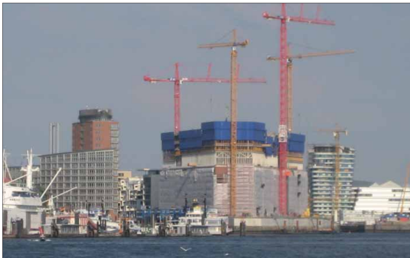
Die explodierende Elbphilharmonie

Am 10. Februar stand in der Bürgerschaft auf Antrag der SPD-Fraktion das Thema »Explodierende Kosten bei städtischen Baumaßnahmen« auf der Tagesordnung.