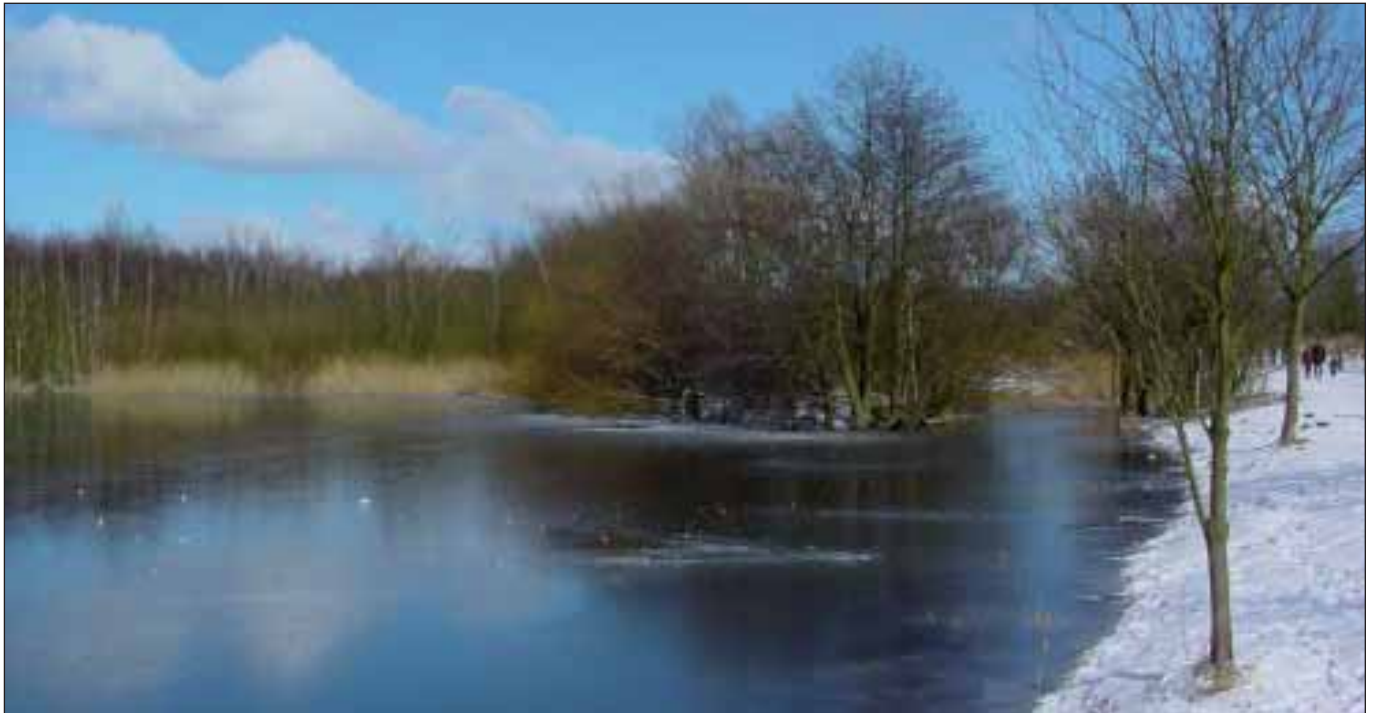
Glinde Au speist die Ökokraft der Bille

Verschiedene Vorgänge um die Beseitigung und Neugestaltung von Grünflächen in Hamburg-Mitte berühren auch einige grundsätzliche Fragen zur Stadtentwicklung im Rahmen der »Wachsenden Stadt«. Städtische Grünflächen, die im Bezirk Mitte etwa 600 ha mit 400 ha reinen Parkanlagen einnehmen, erfüllen wichtige ökologische und soziale Funktionen.